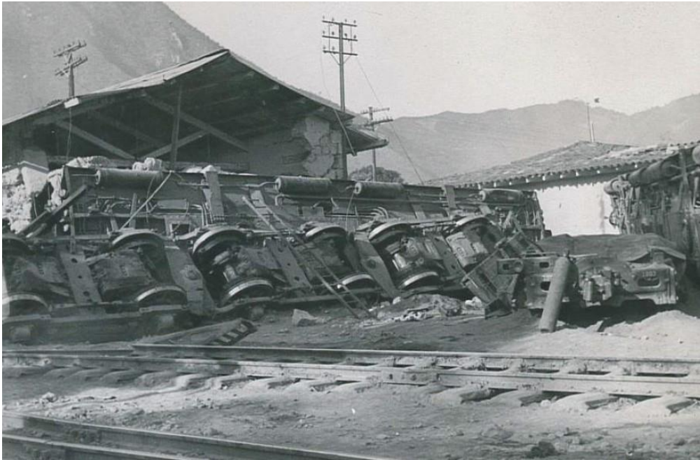
Las locomotoras 1008 y 1007, volcadas, dañaron los muros de la bodega en la estación de Maltrata, Veracruz. SICT

La estación de tren de Maltrata, Veracruz, fue escenario de otro accidente de graves consecuencias. El tren No. 5 del Ferrocarril Mexicano formado por las máquinas 1008 y 1007 más dos vagones de segunda, uno de primera y el vagón del exprés; y tres vagones más (comedor y dormitorios), se descarriló el 22 de junio de 1958. En el tramo entre la ciudad de Orizaba y la población de Esperanza falló el suministro de energía en la línea aérea que alimenta al tren, por lo que se detuvo a la altura del kilómetro 269. El maquinista aplicó los frenos de aire, y se comunicó por telegráfico con el personal de la subestación; le informaron que la corriente estaba interrumpida y que tenía que esperar a que se solucionara este problema.