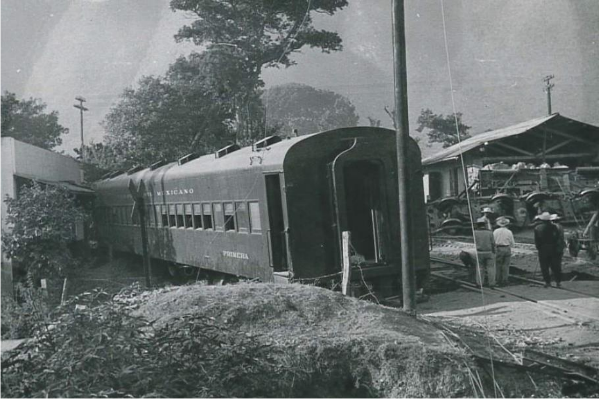
El vagón de primera clase detuvo su marcha ante la casa del jefe de la estación. SICT.

cortándose la corriente eléctrica, asimismo un poste telegráfico del ferrocarril y otro de los telégrafos Nacionales corrieron la misma suerte. 3